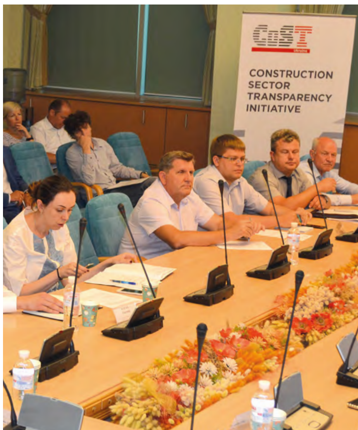
Навчання посадових осіб облавтодорів