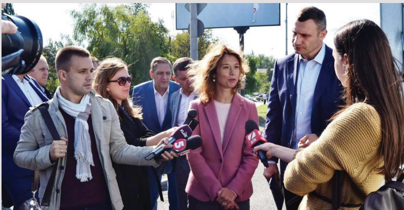
CoST Ucrania atiende a los medios de comunicación

Los resultados de CoST hablan por sí mismos: de la divulgación de datos de más de 6,000 proyectos de infraestructura en el año 2017 (el doble de lo divulgado en 2016); a la cancelación de un contrato para la reconstrucción del Puente Belice de Guatemala, lo que evitó la malversación de 5 millones de dólares estadounidenses; a la reparación de un puente defectuoso en Ucrania; a detener la contaminación ambiental en el sitio de una obra de construcción en Honduras; hasta un ahorro de 3.5 millones de dólares (USD) en el mejoramiento de la carretera de Gindebir a Gobensa en Etiopía, obra que ahora representa una línea vital a hospitales, escuelas y la economía local.