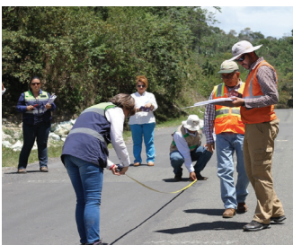
Ciudadanos y ciudadanas que ayudan a auditar socialmente proyectos de infraestructura pública

Desde su adhesión a CoST en 2014, Honduras ha desarrollado un enfoque altamente innovador para la implementación de CoST sobre la base de los principios de la OGP.